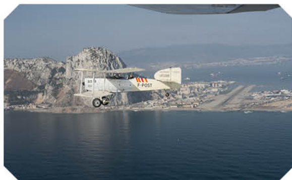
B14 Gibraltar Breguet XIV au-dessus de Gibraltar ©Jean-Claude Nivet Association Breguet XIV