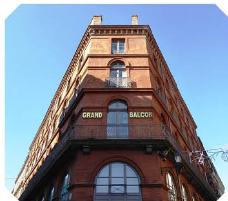
Grand Balcon Hôtel du Grand Balcon où logeait St-Ex et les autres pilotes à Toulouse