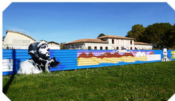
Envol des Pionniers 4 Bâtiments de l'aérodrome de Toulouse-Montaudran en cours de rénovation

Cap Juby St-Ex à Cap-Juby en 1928