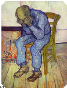
> Le Vieil Homme triste ( Vieil homme pleurant ) - 1890 - Vincent Willem van Gogh (1853/1890) - huile sur toile, 80 x 64 cm - Otterlo, Rijksmuseum Kröller-Müller, Pays-bas.

Orphée est accablé de douleur. Il vient de perdre pour la seconde fois Euridice dont il est fou amoureux. Il sait que maintenant, il ne peut plus rien pour elle... Appuyé sur sa lyre, les yeux remplis de larmes, il ne peut contenir son désespoir et le regard plein de bienveillance du lion n'y pourra rien changer.