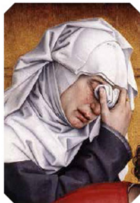
> Les larmes de Marie, mère de Jacques (ou Marie de Clopas) Détail de La Descente de Croix - Rogier van der Weyden (1400/1464). Musée du Prado (Madrid) 1435/38.

Un jeune homme vient de mourir, supplicié en croix par les Romains, après une agonie longue et douloureuse. Plusieurs femmes sont restées là courageuses et l'ont accompagné jusqu'au bout. Maintenant qu'il est mort, le chagrin peut s'exprimer et la douleur éclater... les larmes coulent sans retenu et inondent le visage de l'une d'elles. Un mouchoir sur les yeux, cette femme semble vouloir oublier ce qu'elle vient de vivre, elle s'isole du monde, le corps penché en avant sous le poids du chagrin.